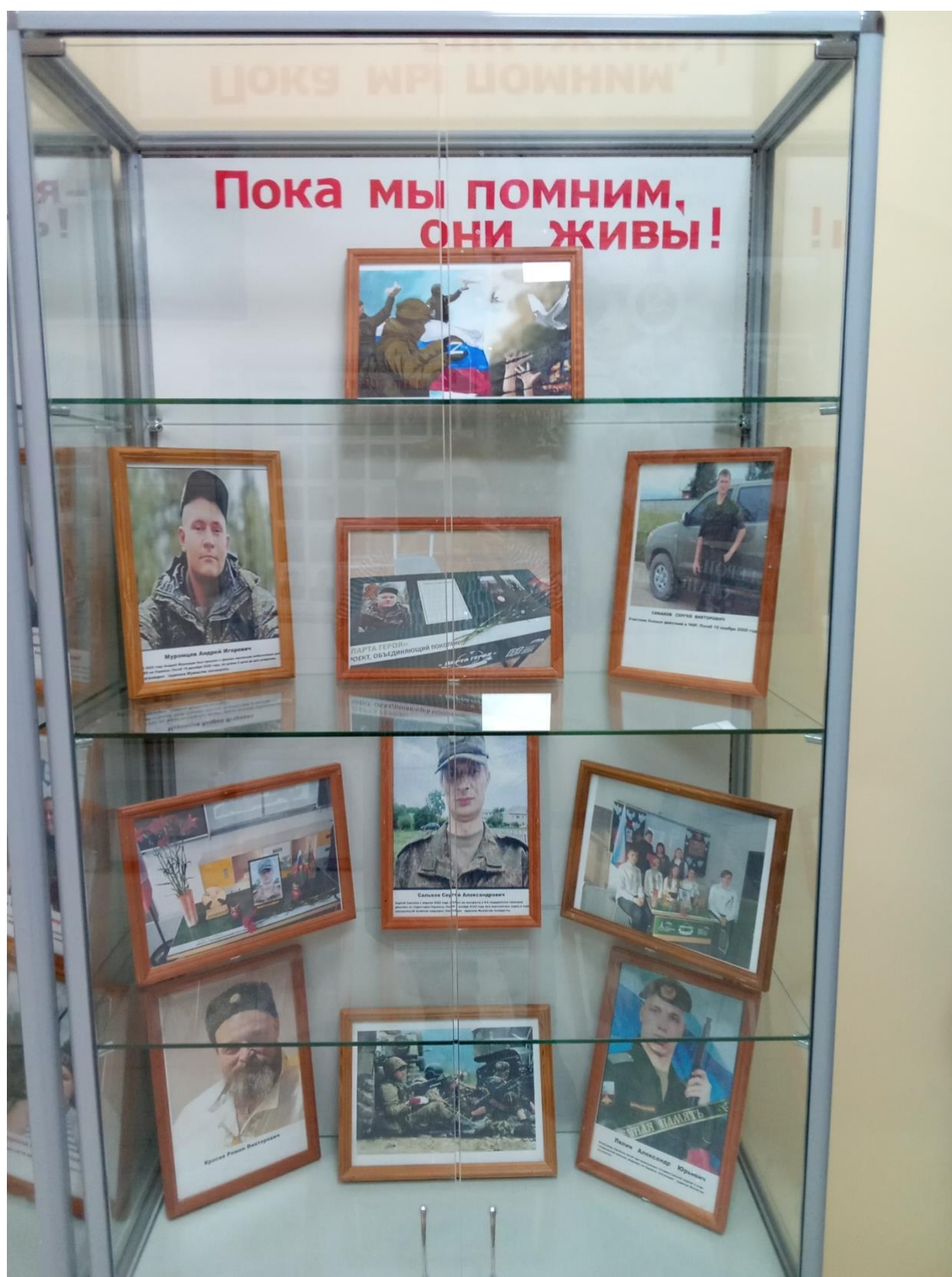
Подиумная экспозиция « В солдатском блиндаже ,СВО»